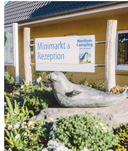
Startpunkt Nordseecamping Starting Point

Wadden Sea National Park. Close to Husum's Mühlenau, the route takes you overland through the Südermarsch towards Uelvesbüll. The sparsely populated landscape is exactly as you imagine the north to be – flat or as they say here „platt“. Last stage: Simonsberg. The North Sea and numerous storm surges have shaped Simonsberg.