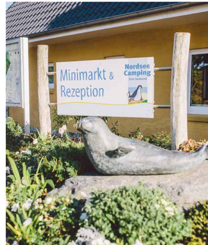
Startpunkt Nordseecamping Starting Point

Wadden Sea National Park. Close to Husum's Mühlenau, the route takes you overland through the Südermarsch towards Uelvesbüll. The sparsely populated landscape is exactly as you imagine the north to be – flat or as they say here „platt“. Last stage: Simonsberg. The North Sea and numerous storm surges have shaped Simonsberg.